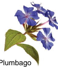
Plumbago (doute de l'intuition)

Inscriptions: Bruno SCHMUCKI 24 rue de Ganadure 33380 MIOS 06 76 49 80 06 bruno@lesfleursdebach.net www.lesfleursdebach.net